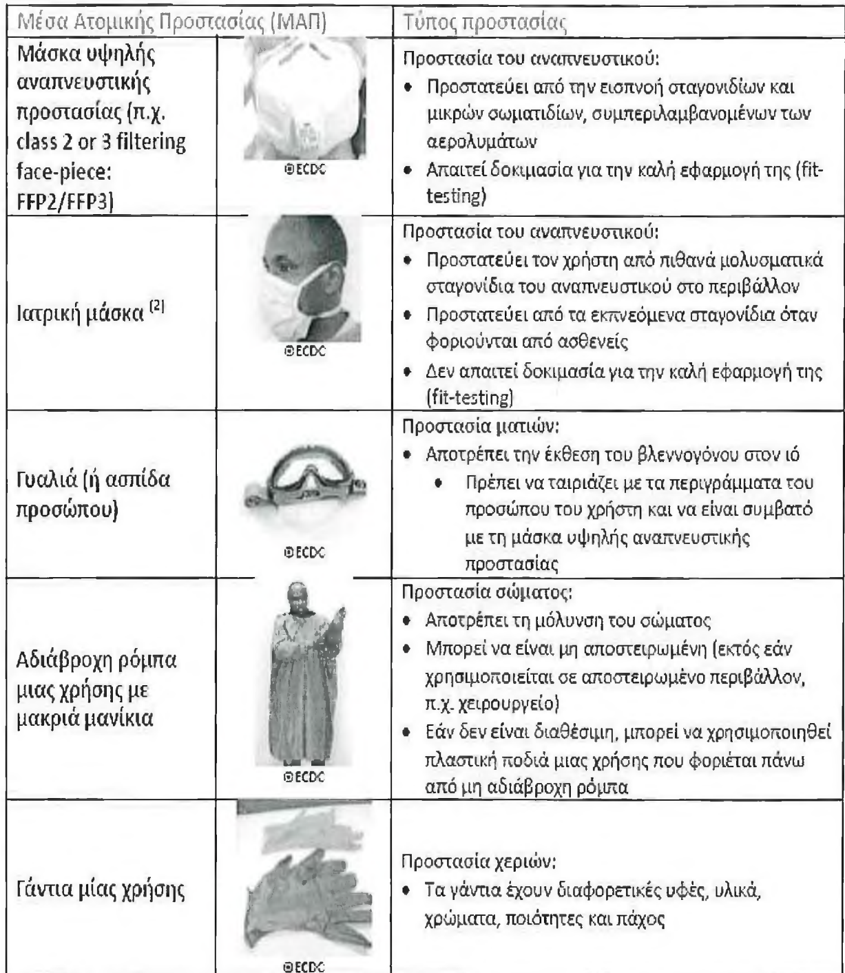
Πίνακας 1. Σύνοψη και σειρά εφαρμογής και αφαίρεσης των κύριων ΜΑΠ που παρουσιάζονται στο παρόν έγγραφο και προσφερόμενη προστασία 1